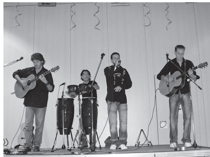
• De 'Desperados' in De Plantage.

tel. 035 - 6022826 internet.www.datadidact.nl